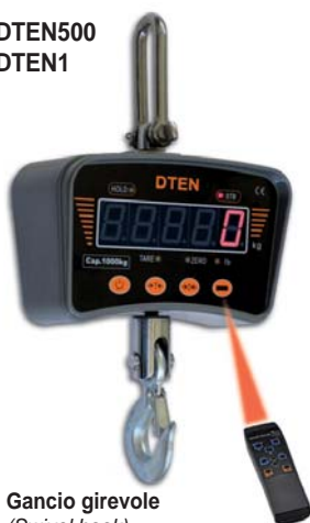
Gancio girevole (Swivel hook)