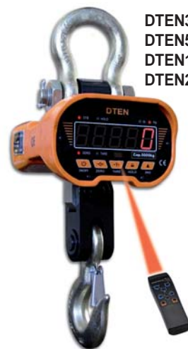
DTEN3 DTEN5 DTEN10 DTEN20